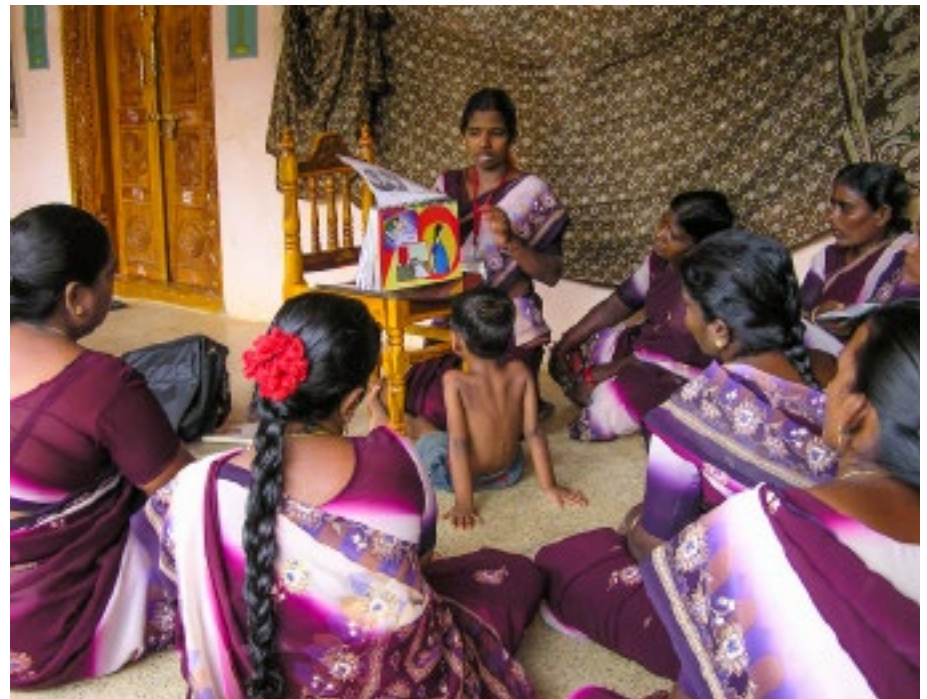
► Workshop voor vrouwen over HIV-risico's

MEER INFO: www.sahaya.eu EN www.sahaya.org . BEKIJK OOK DE KORTFILM OVER DE ORGANISATIE (INGESPROKEN DOOR JEREMY IRONS) OP www.sahayagoingbeyond.org .